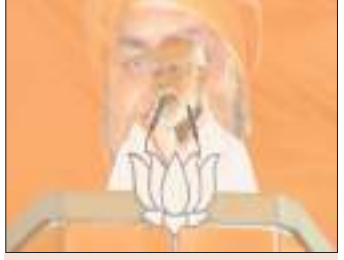
आरजेडी-कांग्रेस ने राम मंदिर का उपहास उड़ाया, सभी भ्रष्टाचारी आज एक होकर बोल रहे हैं

पीएम नरेंद्र मोदी ने गुरुवार को जमुई के खेरा में सभा को संबोधित किया। इस दौरान उन्होंने लालू के जंगलराज, भ्रष्टाचार और इंडी अलायंस पर निशाना साधा। पीएम ने कहा कि पहले आतंकी हमारे ऊपर हमला कर के चले जाते थे। कांग्रेस दूसरे देशों के पास शिकायत लेकर जाती थी। हमने कहा ऐसे नहीं चलेगा। आज का भारत घर में घुसकर मारता है। पीएम मोदी ने आगे कहा कि ये चुनावी सभा है या विजय सभा है। उन्होंने चिराग पासवान और जमुई से कैडिडेट उनके बहनोई को अपना भाई बताया। पीएम ने कांग्रेस और आरजेडी पर निशाना साधा। उन्होंने कहा कि इन पार्टियों ने देश का नाम खराब किया है। सभा को संबोधित करते हुए बिहार के मुख्यमंत्री नीतीश कुमार ने कहा कि नरेंद्र मोदी फिर देश के प्रधानमंत्री बनेंगे। उन्होंने भी लालू सरकार के जंगलराज की याद दिलाई। कहा- पहले हिंदू-मुस्लिम का झगड़ा होता था। अब सब कंट्रोल में है। इन लोगों को ले आएं तो ये फिर से यही सब करवाएंगे।